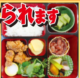
お弁当例(お弁当は日替りです。)

5・6年生を対象にお弁当の配達をしています。作りたての美味しいお弁当が事前の注文(当日など急な注文でも対応可)で塾のお弁当時間前に配達されます。急な用事やお仕事でお弁当が間に合わない方は是非ご活用ください。(1日単位でお申し込みできます) ●詳しくは http://www.lets-jr.com/bento.html をご覧ください。