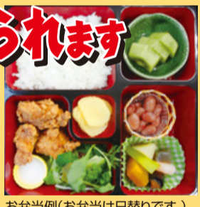
お弁当例(お弁当は日替りです。)

●詳しくは http://www.lets-jr.com/bento.html をご覧ください。