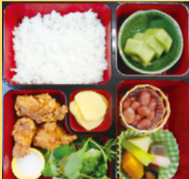
お弁当例(お弁当は日替りです。)

●詳しくは http://www.lets-jr.com/bento.html をご覧ください。