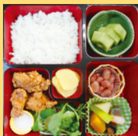
お弁当例(お弁当は日替りです。)

●詳しくは http://www.lets-jr.com/bento.html をご覧ください。