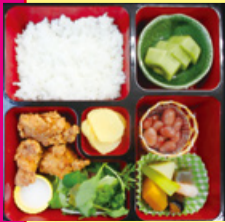
お弁当は日替りです。

そんなこだわりのお弁当がワンコインの500円(本体463円)で注文出来るようになりました。お仕事が忙しくお弁当を作ることが難しい方は是非ご活用ください。(1日単位でお申し込みできます)